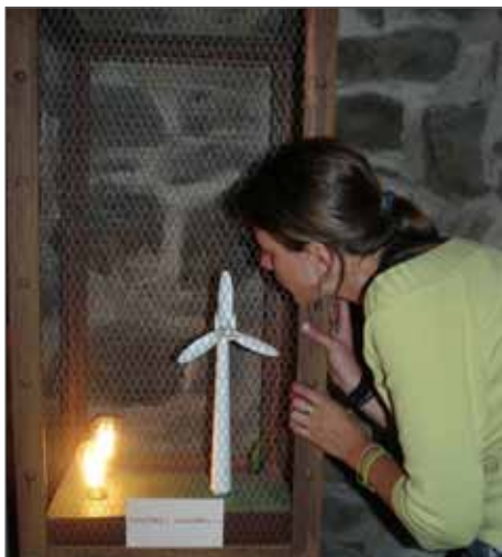
École du Vent

Le thème de l'énergie et du changement climatique est en vogue... mais on entend souvent tout et son contraire. Il y a ce que l'on dit, ce que l'on croit... mais qu'en est-il vraiment ? Pour le savoir, rendez-vous à L'École du Vent où plusieurs expositions vous attendent. Entre données scientifiques et approches sensible et artistique, faites-vous votre propre opinion... vous ne resterez pas insensibles ! Et pour jouer le jeu, munissez-vous d'une image, d'un dessin, d'une photographie qui évoque pour vous l'énergie : un atelier participatif et créatif sera en effet proposé sur place le samedi 13/10 dès 14 h 30 par Pôlénergie. Le photo-langage : une façon originale d'aborder ce sujet crucial !