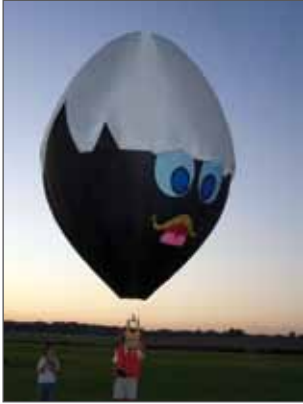
Mini-mongolfière CHARLY - Arc et Senans 2012

L'espace a toujours fait rêver les Hommes. Dans cette quête, la démarche scientifique et la spéculation de la science-fiction se sont tour à tour nourries, confrontées, voire opposées. Cette manifestation est l'occasion de voir que le rêve est toujours bien présent. Au programme : conférences, expositions et spectacles vivants.