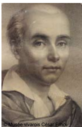
Joseph et Etienne MONTGOLFIER